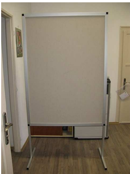
Ilustrační obrázek č. 1