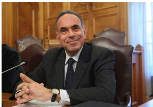
Ministr vzdělávání a náboženských záležitostí Řecké republiky Konstantinos (Kostas) Arvanitopoulos, předseda rady ministrů EYCS

Za nebývale ambiciózní a komplexní označuje už nyní řada členských států priority a program řeckého předsednictví v Radě EU pro oblast vzdělávání a odborné přípravy. Zaměřit se hodlá například na posílení evropské spolupráce v oblasti vysokoškolského i odborného vzdělávání, zajišťování kvality vzdělávání nebo sociální soudržnosti . Zejména chce ale využít toho, že po dlouhé době jsou prakticky ve stejný moment k dispozici výsledky Education & Training Monitoru Evropské komise pro rok 2013 , výzkumů PISA a PIAAC a závěry Roční analýzy růstu EU . Ty podle nového předsednictví ukazují, že EU potřebuje, aby vzdělávání jako nezbytný předpoklad oživení ekonomického růstu v Evropě mělo významnější místo v koordinaci hospodářských politik EU . K získání takového místa a zároveň k zajištění urychlených reakcí na nesoulad mezi dovednostmi Evropanů a potřebami pracovního trhu, musí členské státy podle předsednictví