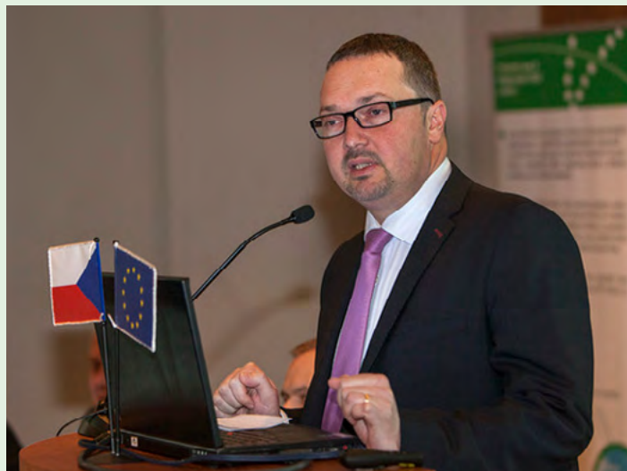
Náměstek ministra pro řízení programů EU Michal Zaorálek

Ředitel Odboru řízení OP VaVpI Jan Radoš během své prezentace zmínil aktuální skokový nárůst alokace programu po listopadové intervenci ČNB na kurz koruny s možnými dopady na stav čerpání programu, ale také informoval účastníky o hlavních úkolech, které ŘO čekají v roce 2014. Připomenul audit NKÚ, který po téměř půlroční kontrole konstatoval plnou funkčnost a účinnost systému řízení programu OP VaVpI. O všech těchto tématech MŠMT v průběhu roku 2013 informovalo širokou veřejnost a média.