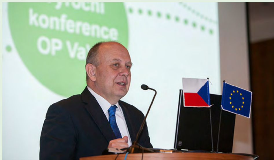
Ministr školství Dalibor Štys