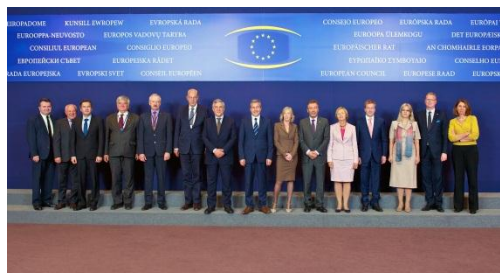
Představitelé členských států na zasedání Rady pro konkurenceschopnost ve formaci ministrů odpovědných za výzkum

Dne 26. května 2014 proběhlo v Bruselu zasedání Rady pro konkurenceschopnost. Předmětem jednání Rady ve formaci ministrů zodpovědných za agendu výzkumu byla zejména prioritizace ESFRI (European Strategy Forum on Research Infrastructures – Evropské strategické fórum pro výzkumné infrastruktury) Roadmap projektů výzkumných infrastruktur , kdy byl přijat seznam prioritních projektů vypracovaný expertní skupinou ESFRI, které splňují kritéria předpokládající jejich úspěšnou implementaci do roku 2015/2016, přičemž tyto výzkumné infrastruktury by měly být podpořeny z aktuálně běžící výzvy INFRADEV-3 rámcového programu EU pro výzkum a inovace Horizont 2020 . Současně byla podpořena idea využívání prostředků evropských strukturálních