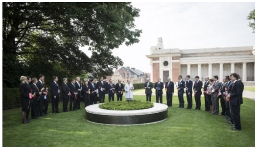
Lidři EU v Ypry

Ve dnech 26. a 27. června 2014 proběhla Evropská rada, jejíž zahájení proběhlo netradičně v belgickém městě Ypry , kde bylo připomenuto sté výročí vypuknutí první světové války . Program pokračoval společnou večerí s diskuzí nad strategickou agendou EU pro nadcházející roky.