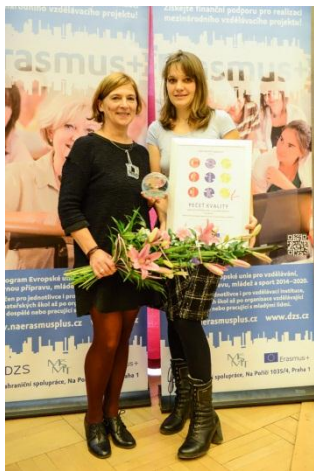
Zástupkyně Sítě mateřských center, oceněné v rámci programu Grundtvig