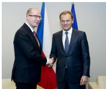
Předseda vlády ČR Bohuslav Sobotka se vítá s prezidentem Evropské rady Donaldem Tuskem

Ve dnech 19. a 20. března se uskutečnilo zasedání Evropské rady, které bylo zahájeno minutou ticha za oběti teroristického útoku v Tunisku , k němuž došlo dne 18. března 2015.