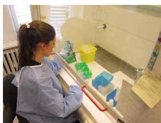
Návštěva laboratoře Univerzitní nemocnice v Oslu

V dubnu 2015 byla aktualizována mezinárodní dohoda o programu mezi Ministerstvem zahraničních věcí Norska a Ministerstvem financí ČR v Česko–norském výzkumném programu CZ09. Alokace programu CZ09 byla navýšena o 2 016 377 eur, tedy přibližně 53 433 991 Kč , které byly přesunuty z programu Pilotní studie a průzkumy pro CCS technologie (zachycování a ukládání CO 2 ) CZ08. Získané prostředky budou plně použity na financování projektů z rezervního seznamu , nikoliv na řízení programu.