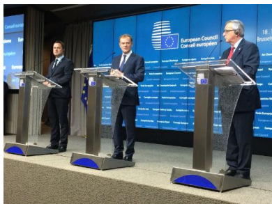
Xavier Bettel, premiér Lucemburska, Donald Tusk, prezident Evropské Rady a Jean-Claude Juncker, prezident Evropské komise

Ve dnech 17. a 18. prosince 2015 proběhla v Bruselu Evropská rada. Tématy jednání byly zejména migrace, boj proti terorismu, hospodářská a měnová unie, energetická unie a také plány Spojeného království na uspořádání referenda .