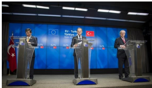
Ahmet Davutoğlu, premiér Turecka, Donald Tusk, prezident Evropské Rady a Jean-Claude Juncker, prezident Evropské komise

Na zasedání konaném dne 17. března 2016 vedoucí představitelé EU jednali o dalších krocích k řešení migrační krize a o spolupráci mezi EU a Tureckem . Diskuze se dotýkala také hospodářské situace a byly přijaty závěry o zaměstnanosti, růstu a konkurenceschopnosti a o klimatu a energetice .