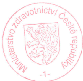
MUDr. Svatopluk Němeček, MBA ministr zdravotnictví

4. Toto Opatření nabývá platnosti a účinnosti dnem jeho podpisu ministrem zdravotnictví a je dodatkem č. 1 ke zřizovací listině Endokrinologického ústavu ze dne 29. května 2012 vydané pod č.j. 17268-XII/2012.